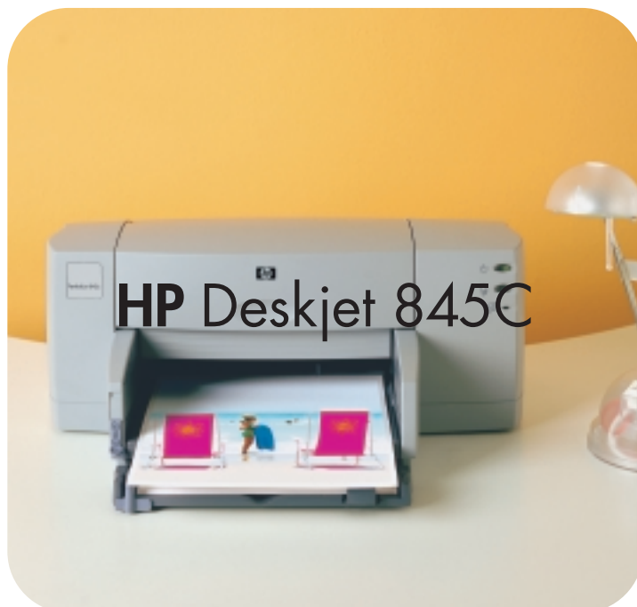
HP Deskjet 845C